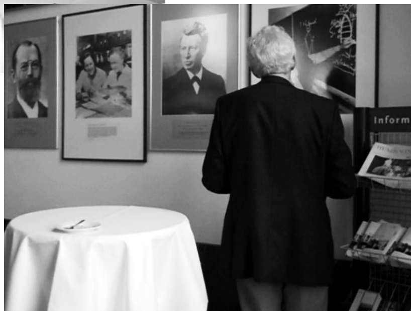
Da staunt der Experte

Anstrengung, noch die Arbeit, noch die Menschen, die sie machen, entsprechend behandelt und anerkannt. Und anders herum gibt es für die, deren Arbeit weniger anerkannt oder beliebt ist, auch nicht mehr Kohle als Ausgleich... im Gegenteil! Für Drecksarbeit gibt es weiterhin wenig oder gar keine Kohle und einen Arschtritt noch dazu. Es kotzt uns echt an!