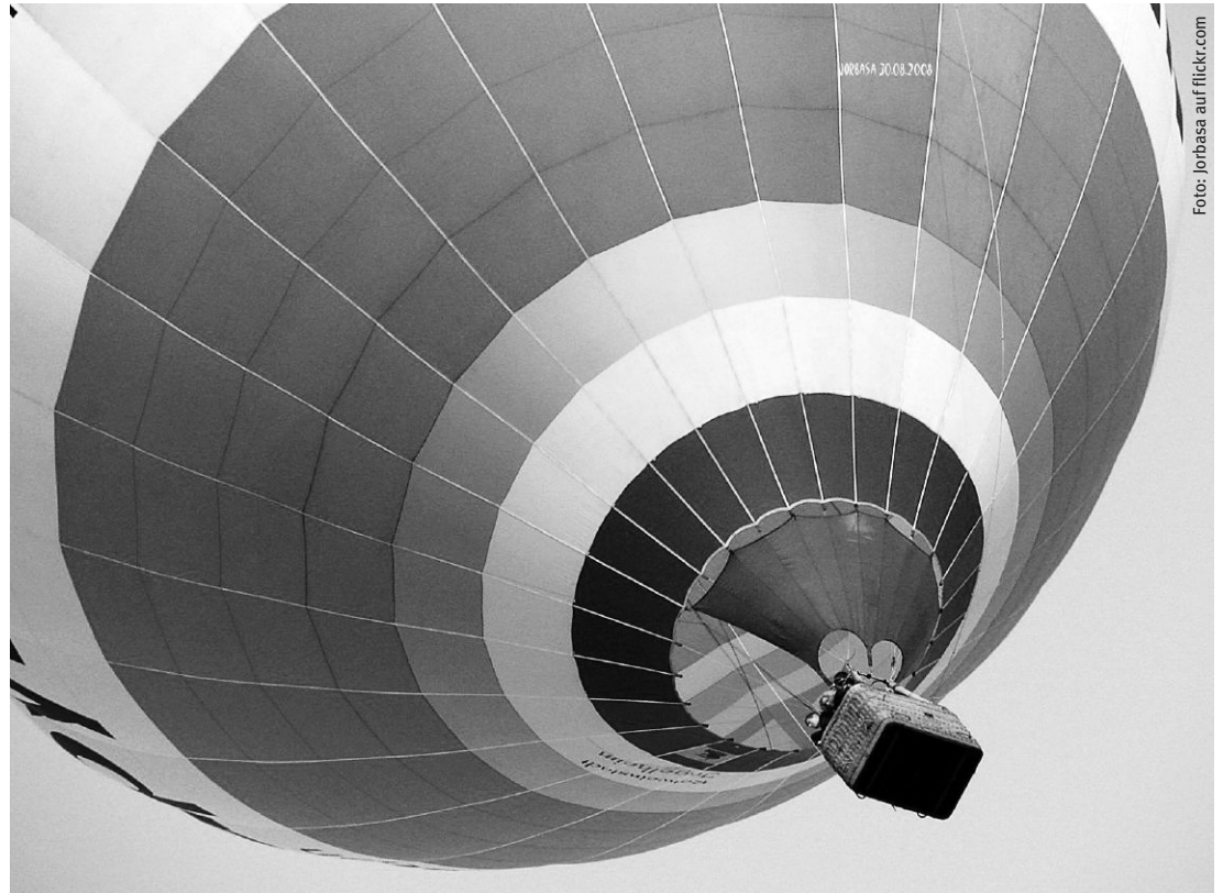
Auch heiße Luft kann uns ein gutes Stück voranbringen.

Weitere Berichte und Ergebnispräsentationen werden bis zum Abschluss des Programms 2013 folgen. Zudem behält es sich die DFG als einer der einflussreichsten wissenschaftspolitischen Akteure in Deutschland vor, die Vergabe der zunehmend bedeutsamen Drittmittelförderung an eine erfolgreiche Umsetzung der Selbstverpflichtungen zu knüpfen.