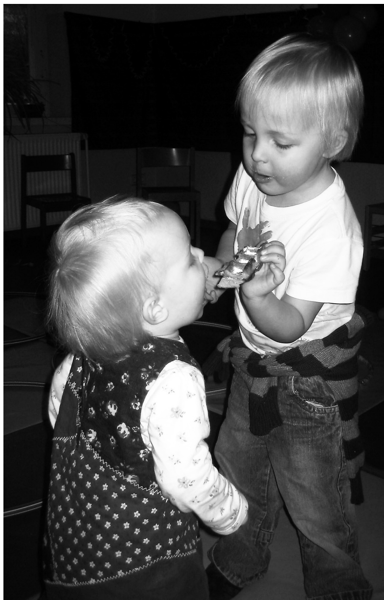
Die Humbolde feiern

Wann der Umzug genau stattfinden wird und ob die eingereichten Vorschläge angenommen werden, ist ungewiss. Es besteht aber durchaus Anlass zu vorsichtigem Optimismus. Das Verhältnis zwischen dem Kinderladen und der Universität ist im Allgemeinen gut. Hierbei ist jedoch nicht zu vergessen, das 1995 ein Streik nötig war um den Kinderladen einzurichten und bei der zunehmenden Verknappung der Gelder für die Universitäten, eine Erweiterung des Betreuungsangebotes nicht ohne jede Menge Ausdauer und Engagement zu erreichen ist. Traditionell ist die Familienfreundlichkeit von Universitäten keine Priorität des Wissenschaftsstandortes Deutschland. Wie sich gezeigt hat, hat die Einführung der Bachelor und Masterstudiengänge zu einer Verschärfung des Leistungsdrucks und der sozialen Situation bei einem Großteil der Studierenden geführt. Dies zeigt sich in den steigenden Zahlen von Burn Outs unter Studierenden und in den großen Protesten der vergangenen Jahre von Studierenden sowie von Lehrenden. Diese Situation trifft Studierende mit Kind ganz besonders. Doch nicht nur sie haben Grund sich auf das geplante Wissenschaftshaus zu