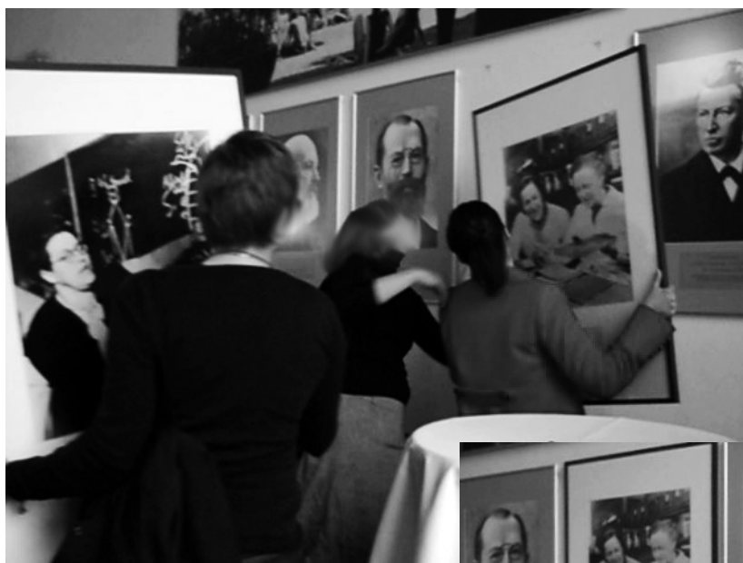
Umverteilung von Anerkennung