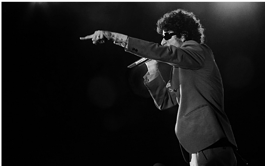
Schon die Beastie Boys wussten: You gotta fight for your right to party!

Grenzüberschreitungen spielen sich aber nicht immer zwischen zwei Personen ab. Auch sexistische, homophobe oder andere derartige Äußerungen sind verletzend und ausschließend. Selbst wenn man nicht selbst Adressat_in solcher Äußerungen ist, sollte man also darauf reagieren und sei es nur, weil man sich sonst den Rest des Abends über die Person ärgert oder das Gefühl hat ein Auge auf sie haben zu müssen, damit nichts passiert. Auch in diesem Fall kann ein Rauswurf angebracht sein.