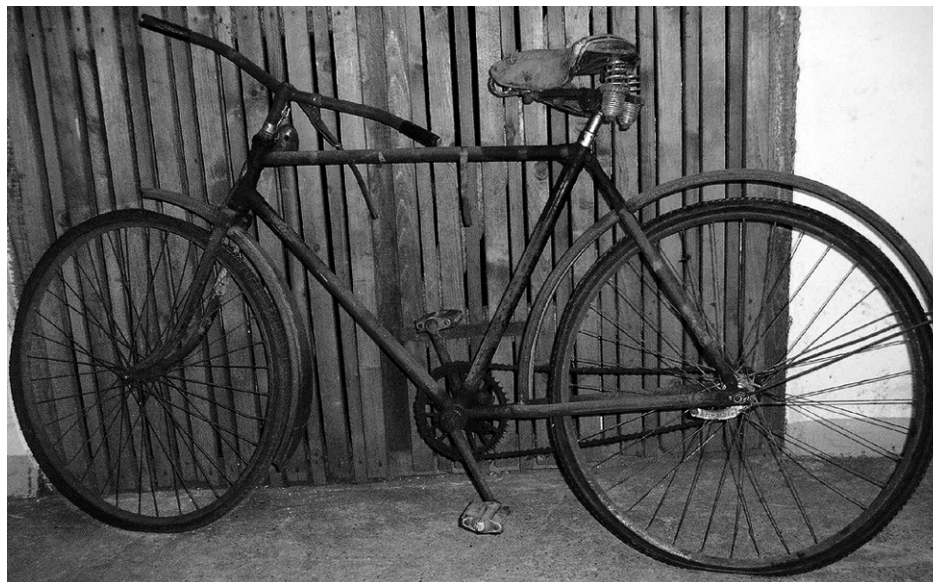
Noch eingerostet – bald wieder Druckmittel gegen die BVG

vor allem in größeren Städten wie Frankfurt/Main, Hamburg und Berlin auftritt: Die Verkehrsbetriebe sehen das Semesterticket nicht nur als Verschiebung eines Postens im Haushalt (von Einnahmen-Azubiticket zu Einnahmen-Semesterticket), sondern als Quelle zusätzlichen Geldsegens. Die Verkehrsbetriebe sind zum Teil hoch verschuldet, die BVG, als Teilunternehmen des VBB unser wichtigster Vertragspartner, hat jährlich Zinszahlungen im zweistelligen Millionenbereich zu leisten. Derweil kürzt der Senat die Zuschüsse zu seinem Unternehmen, gewürzt mit der Aufforderung, endlich rentabel zu arbeiten, verbietet aber gleichzeitig ganz populistisch die Anhebung der Fahrpreise 6 , was so ziemlich die einzige Stelle ist, an der so ein Verkehrsunternehmen versuchen kann, die Einnahmen zu erhöhen. Da kommen die Studierenden ganz recht. Die zusätzlichen Einnahmen durch eine ansonsten ungerechtfertigte Erhöhung des Semesterticketpreises können gut zur Zinstilgung verwendet werden. Lehnen die Studierenden das Ticket ab, bleibt wegen der Rückkehr zum Azubiticketmodell zumindest der solide Sockel an Einnahmen. Das Ticket selbst wird von den Verkehrsbetrieben nur mit Freuden begrüßt, wenn es mit dem „kleinen bisschen extra“ daherkommt. Verlieren können sie nicht wirklich dabei, deshalb verhandelt's sich so schlecht mit ihnen.