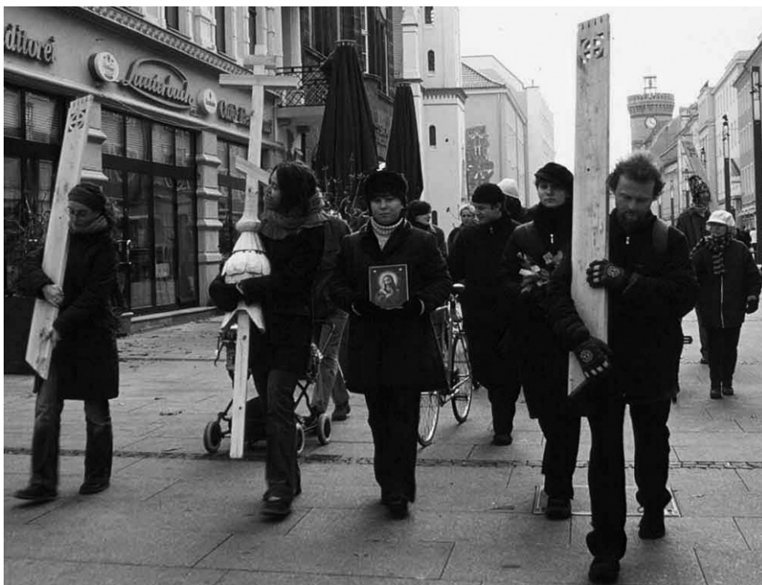
Die Studierenden an der TU haben nun schwer an ihren Kreuzchen zu tragen