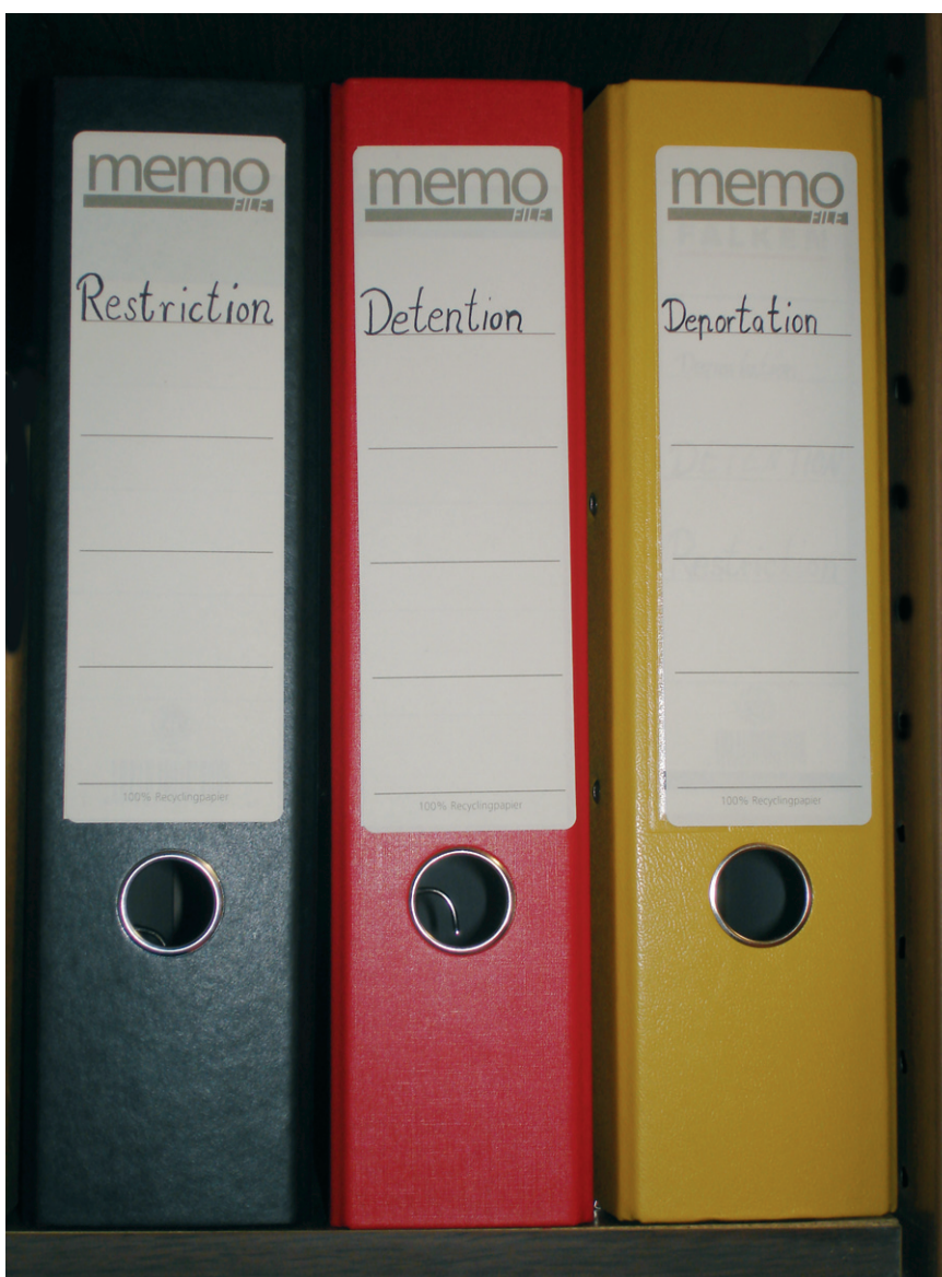
Law and Ordner: Freiheit auf deutsch