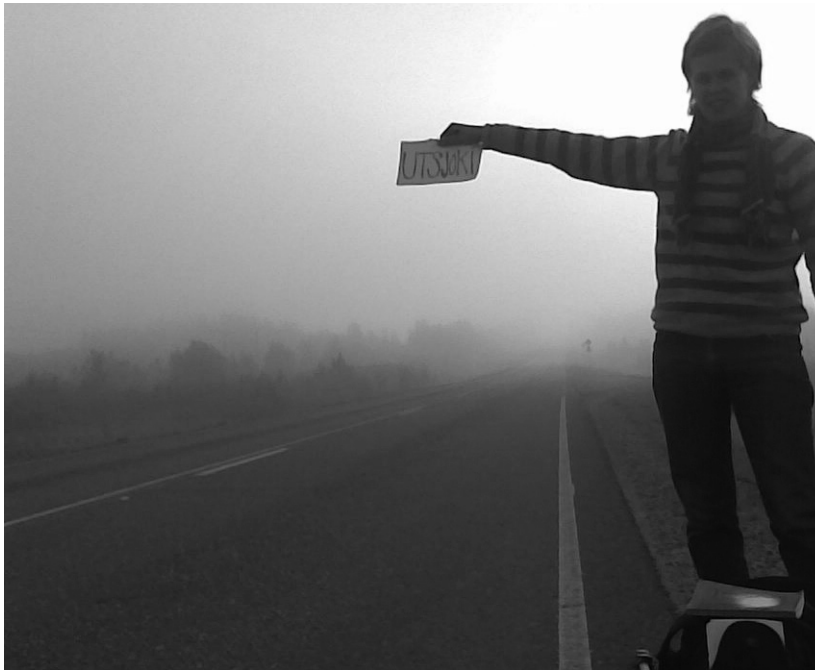
Warten auf den Schulbus

Ein altes Sprichwort sagt: „Reisen bildet“. Denn beim Reisen begibst du dich in unbekannte Situationen, lernst viele Menschen kennen, entdeckst andere Lebensstile und neue Sichtweisen auf die Dinge. Wobei klar ist, dass mit „Reisen“ nicht „Tourismus“, sondern das respektvolle